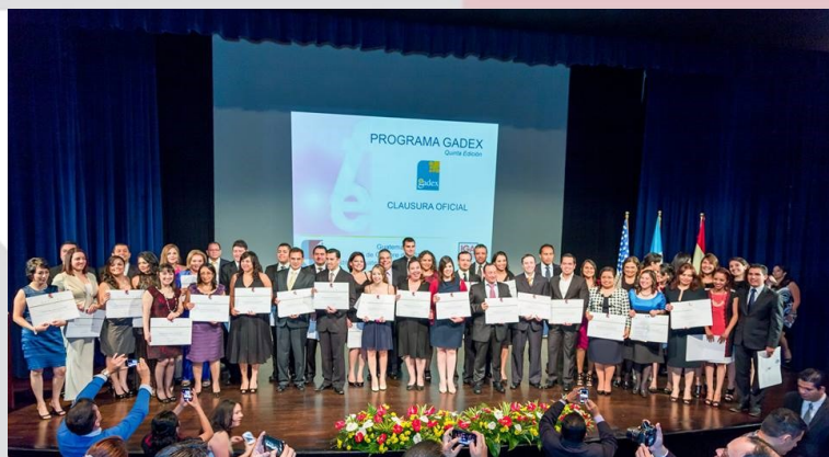
Entrega de títulos Programa Gadex 5ª Edición