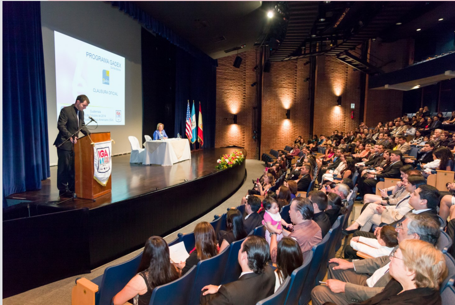
Ceremonia de entrega de títulos a los egresados del Master Executive Gadex 5ª Edición en Guatemala. Octubre 2014