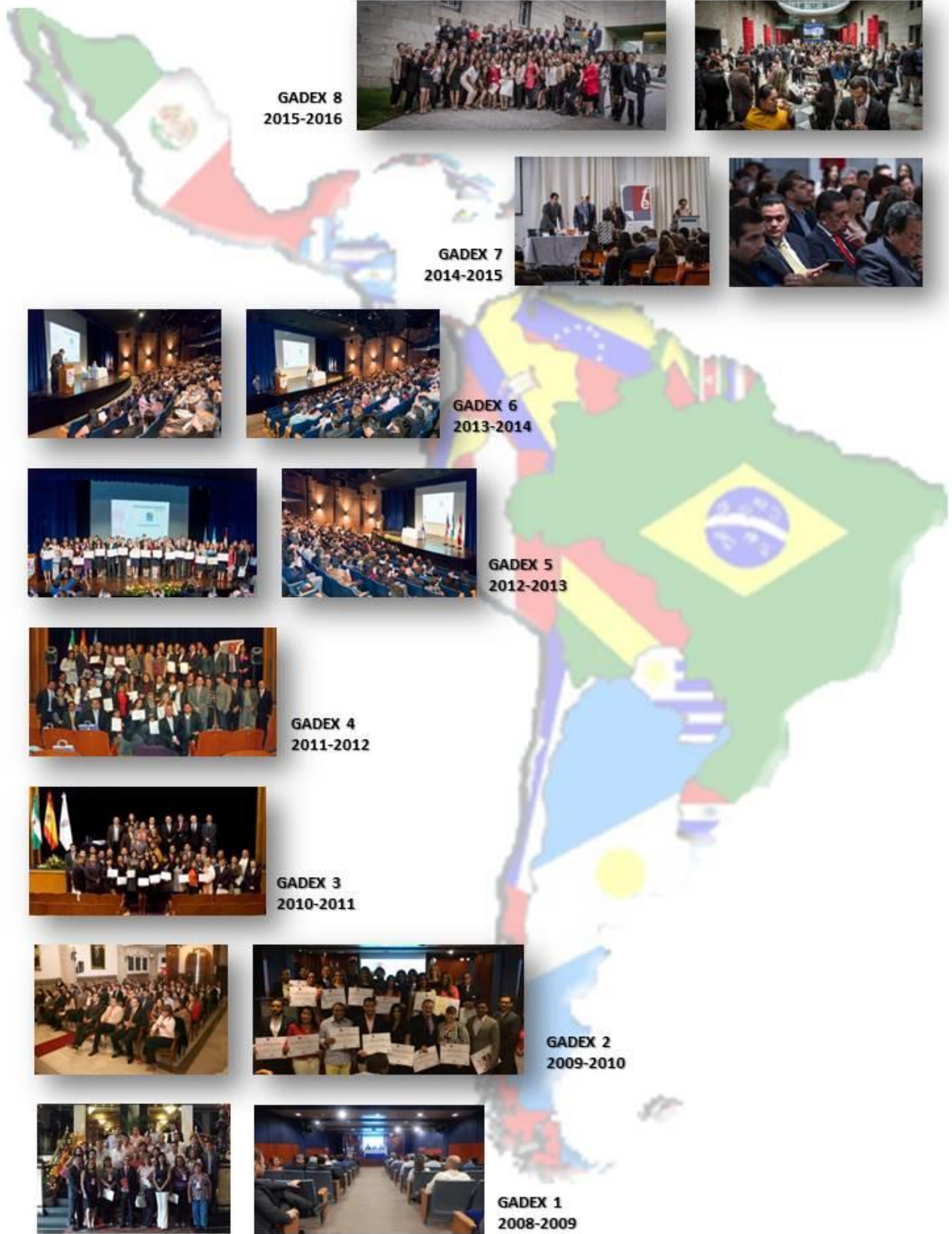
GADEX 8 2015-2016