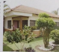
Residencia José Pujol Martí Teléfono #2239-5808 administracion@residenciapujol.com

Nuestra residencia José Pujol Martí construida en el año 1986, ubicada en San Antonio de Belén, ofrece atención al adulto mayor español y de otras nacionalidades con todas las comodidades y atenciones tales como salón de fisioterapia, piscina de hidromasajes, nutricionista, trabajadora social, médico geriatra, enfermería, terapia ocupacional, clases de Tai-chi, pintura o canto entre otros, además contamos con una capilla. Generamos un entorno de bienestar a nuestros mayores, además al estar contiguo al Club Campestre Español tienen la posibilidad de visitarlo para su distracción.