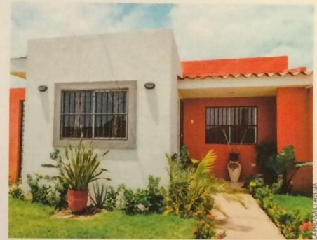
La familia puede estar segura en un lugar como Altos de Las Brisas.

El año pasado hubo 250 alumnos en 27 especialidades.