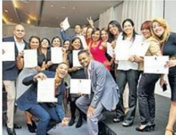
Las maestrías están enfocadas en áreas como administración de empresas, gerencia de negocios, dirección política y otros.