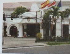
Casa de España, Teléfono # 2296-2575 info@asociacionespanolacr.com